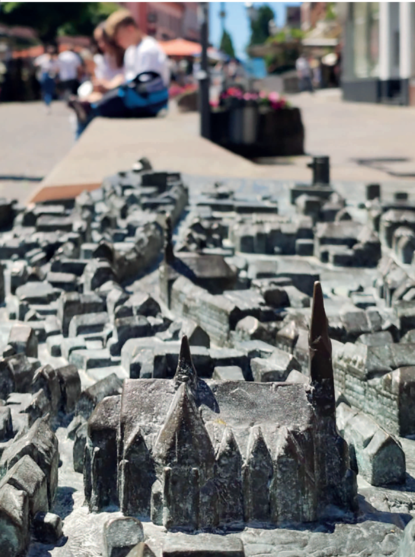
Tastmodell St. Ingbert