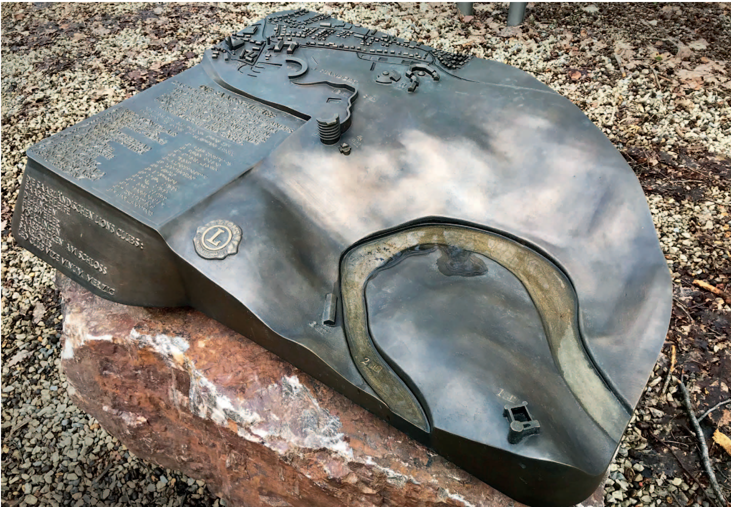
Tastmodell der Saarschleife