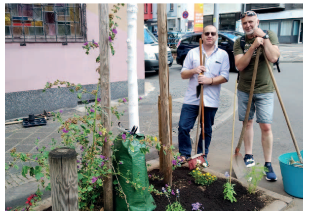
Aufführung von Ehrenamtlichen im Cafe Biblio in der Stadtbibliothek Saarbrücken